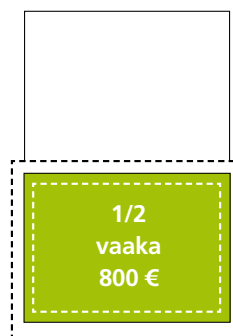
Kokonaispinta-ala 180 x 125 + leikkuuvara 5 mm